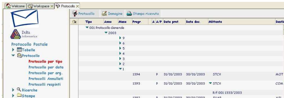
Figura 3 visualizzazione per tipo protocollo - anno - mese